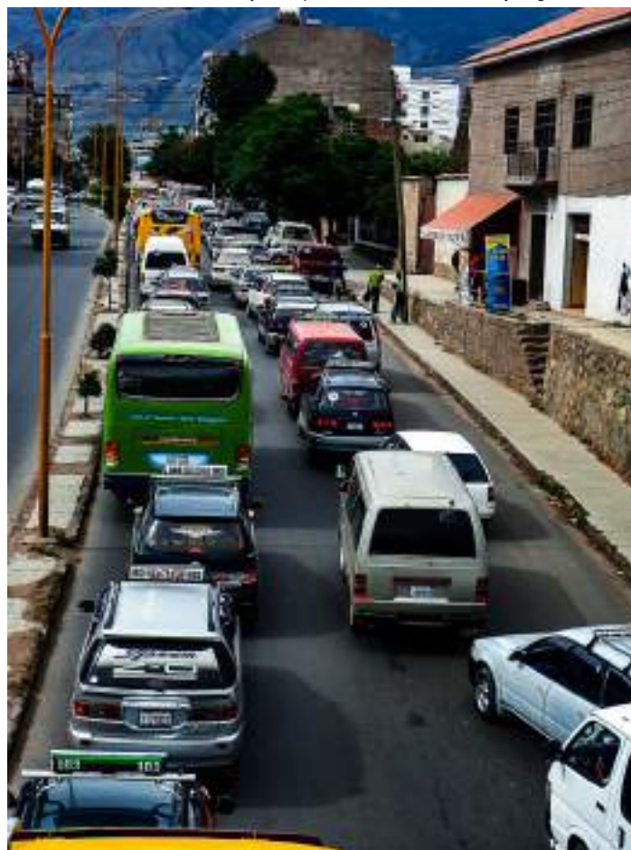
Ilustración DC11: Transporte en la ciudad de Cochabamba | Equipo de comunicación CEPLAG

Se busca vínculos con: ONGs, Gobiernos Autónomos Municipales, Gobernación, entidades internacionales, entidades públicas y privadas; que trabajen con la temática de transporte y movilidad urbana; para la realización de programas en la temática de movilidad urbana y transporte accesible, eficiente y seguro.