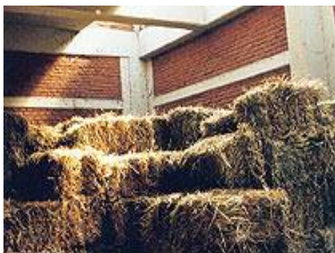
Fig. 36: Pacas de heno avena