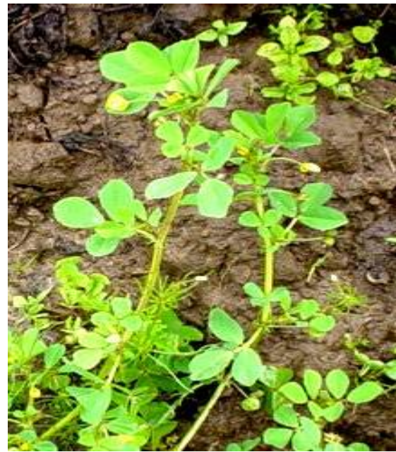
Fig. 5: Garrotilla ( Trifolium sp. )