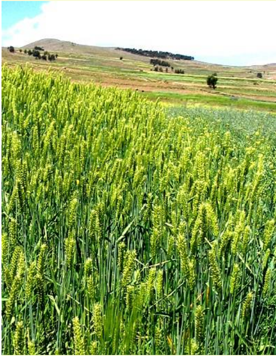
Fig. 6: Cebada ( Hordeum vulgare )