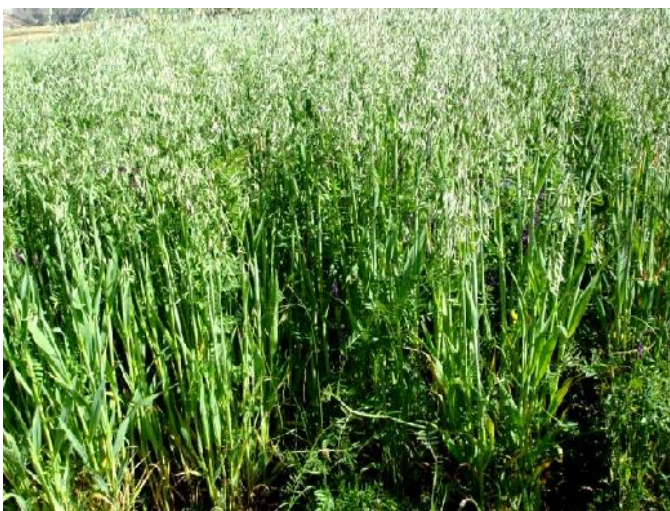
Fig. 27: Avena (Avena sativa)

La avena es un cereal anual, alto, muy cultivado en el altiplano y los valles interandinos de Cochabamba que también se adapta a las condiciones tropicales de gran altitud. Los granos de avena son usados como alimento humano y animal, y la avena se puede usar para pastoreo o para conservar como heno.