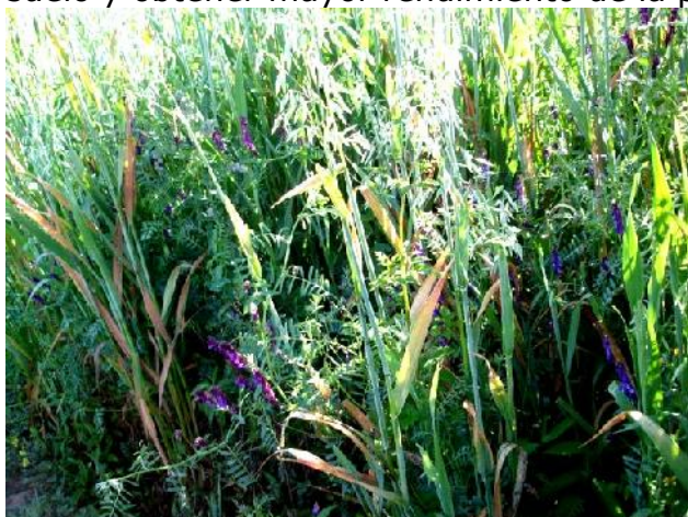
Fig. 25: Veza ( Vicia villosa Roth), en cultivo asociado con avena

El establecimiento se realiza mediante siembra. Los métodos de siembra son a voleo o en surcos, se recomienda el cultivo asociado, el cual sirve como tutor que puede ser maíz forrajero o un cereal menor. Lo cual permite aprovechar mejor el suelo y obtener mayor rendimiento de la pradera.