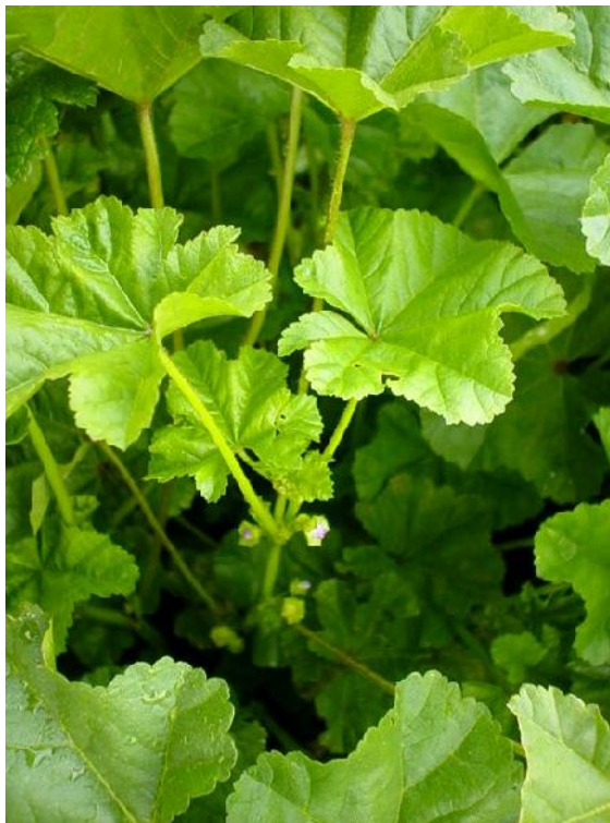
Fig. 42: Malva