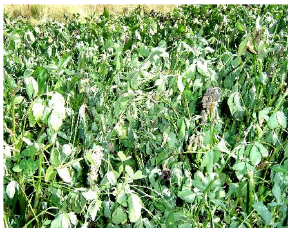
Fig. 28: Daño de helada en el cultivo de tréboles

Los factores climáticos (heladas, sequía, lluvias, etc.), son importantes, al momento de establecer una pradera con forraje y el tipo de especie. La parcela deberá contar necesariamente con riego para disminuir la incidencia por estos factores.