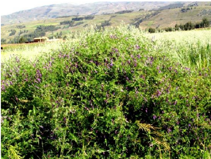
Fig. 24: Veza ( Vicia villosa Roth ), en cultivo puro

El género Vicia , está ampliamente distribuido por todo el mundo, comprende aproximadamente 150 especies. Se distinguen por ser claramente vellosas, con flores abundantes en racimos, pedunculadas y de color púrpura, vainas vellosas y semilla hendida con apéndice. Por tener zarcillos, logran formar enredaderas de crecimiento enmarañado pudiendo asociarse fácilmente con cereales que le sirvan de soporte. Su calidad nutritiva es óptima a la floración.