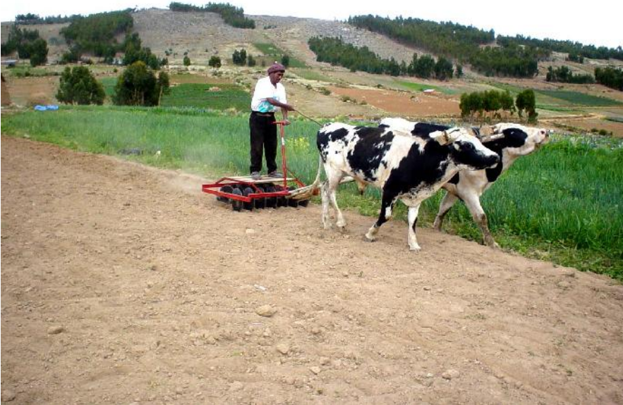
Fig.14: Rastreado para la siembra de alfalfa

Es una labor que consiste en desmenuzar los terrones grandes de tierra formados durante el arado. Además puede realizarse la enmienda o encalado. Actividad que es de gran importancia dentro de las labores culturales que se realizan dentro de la preparación de los suelos, el rastreado favorece la nivelación del suelo, lo que facilita algunas labores culturales como la siembra, riego y otras.