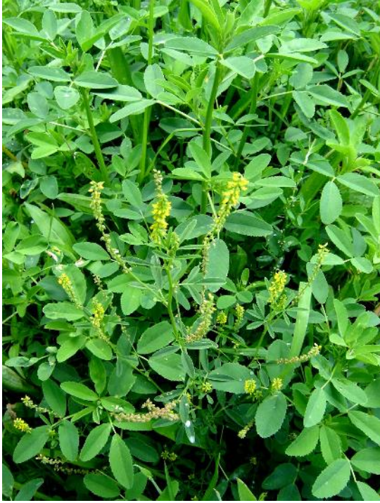
Fig. 37: Medicago falcata