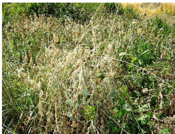
Fig. 29: Daño por helada en el cultivo de alfalfa