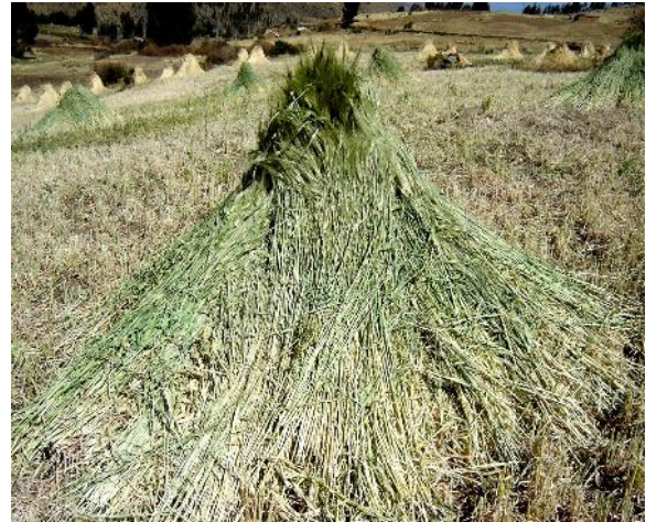
Fig. 31: Kalchas de cebada secando en campo para heno.