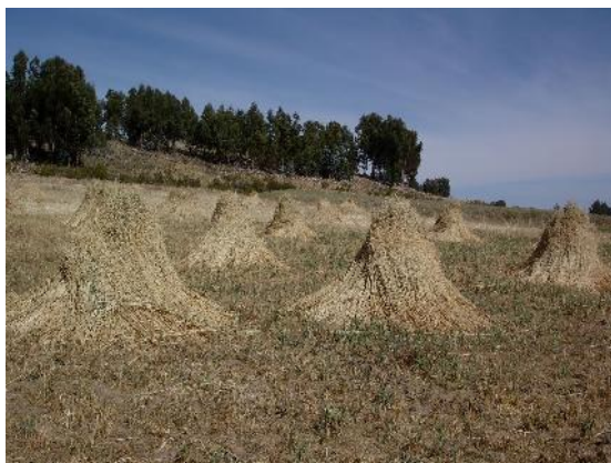
Fig. 35: Secado de heno de avena