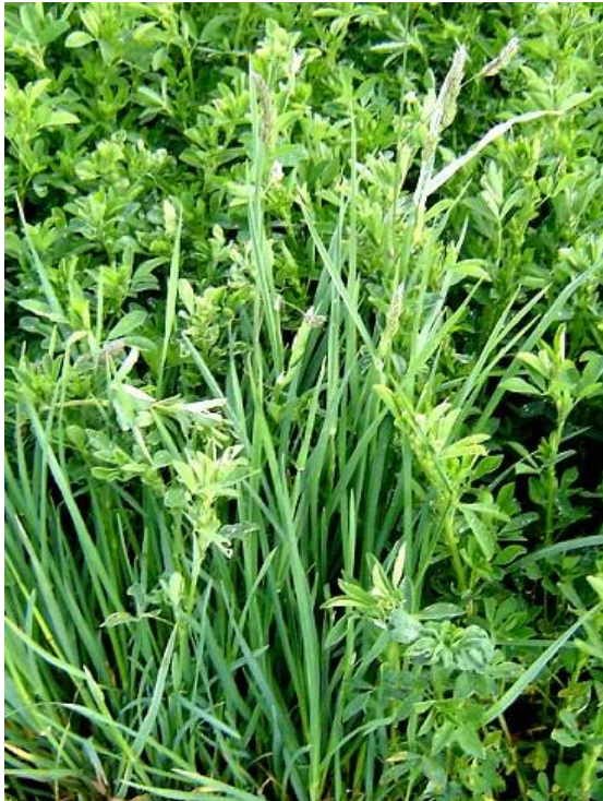
Fig. 8: Dactylis glomerata