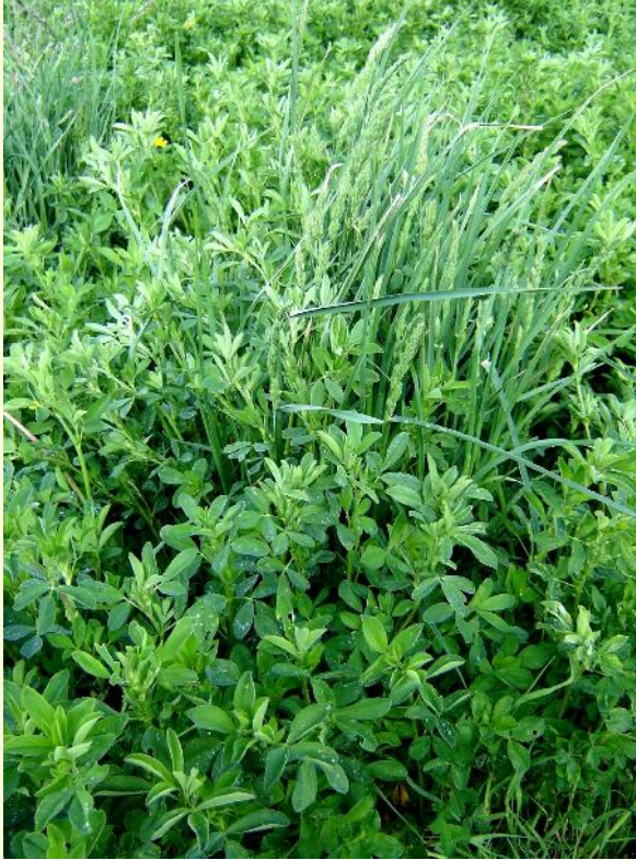
Fig. 10: Festuca Alta ( Festuca arundinacea )