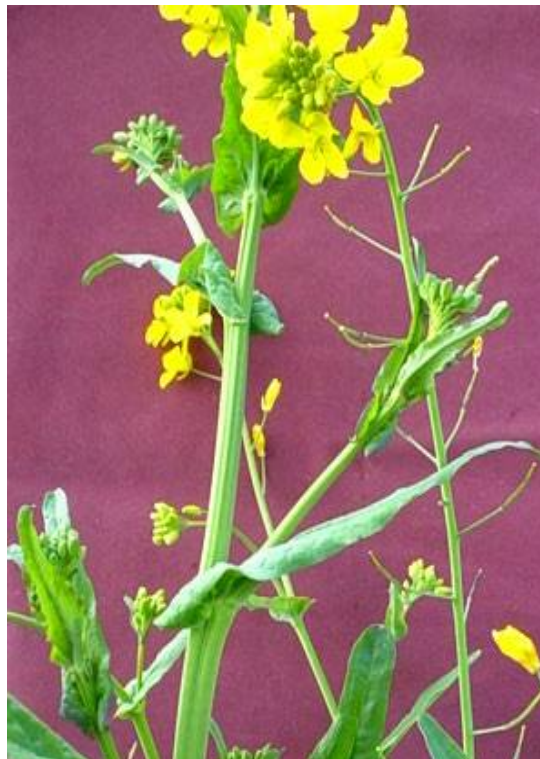
Fig. 43: Nabo silvestre