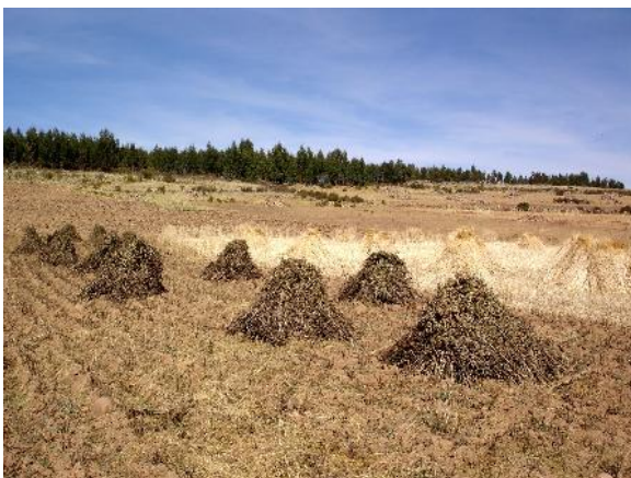
Fig. 32: Kalchas de haba y cebada