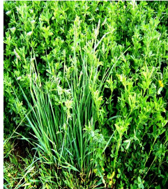
Fig. 22: Dactylis glomerata asociado con alfalfa