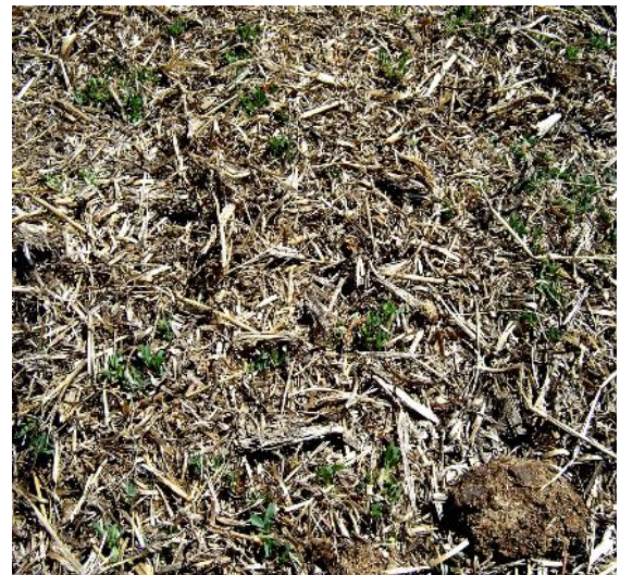
Fig. 18: Estiércol aplicado en cultivo de trébol rojo