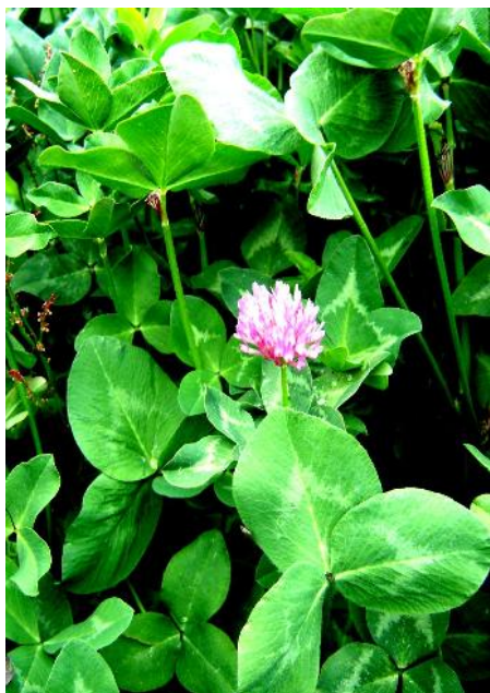
Fig. 23: Trébol rojo Trifolium pratense

El trébol rojo, es cultivado en regiones templadas frías y húmedas y tolera inviernos muy fríos. En Bolivia, se tienen dos cultivares: cv. Violeta obtenido en el CIF, es precoz, en dos años puede alcanzar como promedio nueve cortes, y el cv. Kenland, que alcanza siete cortes en el mismo tiempo (Lazarte, 1996).