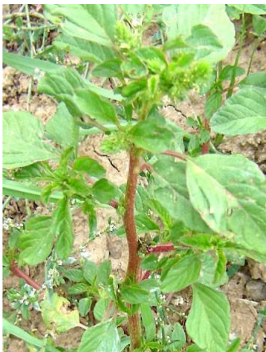
Fig. 44: Amarantus sp. Jataq'ó