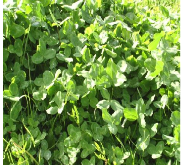
Fig.3: Trébol rojo ( Trifolium pratense )