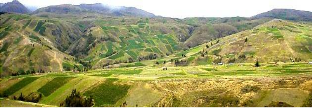
Fig. 12: Vista general de áreas de cultivo en la comunidad de Qolque Jhoya - Tiraque

Suelo, es aquella capa superficial de la tierra, formado naturalmente y constituido por muchos elementos. Desde el punto de vista agrícola suelo es el medio natural donde se desarrollan las plantas.