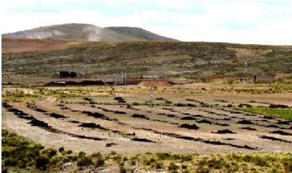
Fig. 16: Aplicación de estiércol

La cantidad de estiércol aplicado al momento de la siembra es importante debido a que generalmente los cultivos forrajeros llamados perennes estarán en explotación por un mínimo de cinco años, proporcionarle las condiciones para un buen desarrollo inicial y las posteriores fertilizaciones se realizaran anualmente, con el objetivo de mantener la producción y los rendimientos.