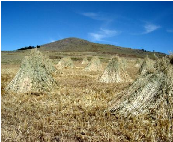
Fig. 30: Kalchas de avena secando para heno

La henificación es un proceso de secado de los forrajes hasta un 10 a 15 % de humedad. Es una técnica de conservación de forrajes, que consiste en almacenar forrajes verdes deshidratados o secos, manteniendo el mayor porcentaje de elementos nutritivos (proteína, minerales, energía, etc.)