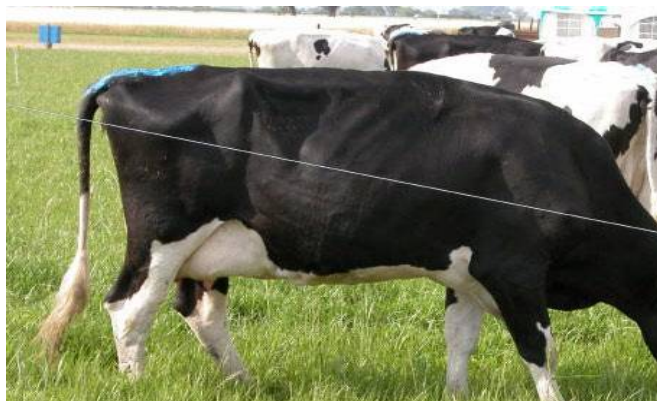
Fig. 1: Bovinos pastoreando en praderas nativas

Por consiguiente, es necesario realizar un adecuado manejo de praderas nativas para evitar la degradación y la erosión de los suelos, lo cual permitirá prevenir la desertificación de las áreas de pastoreo.