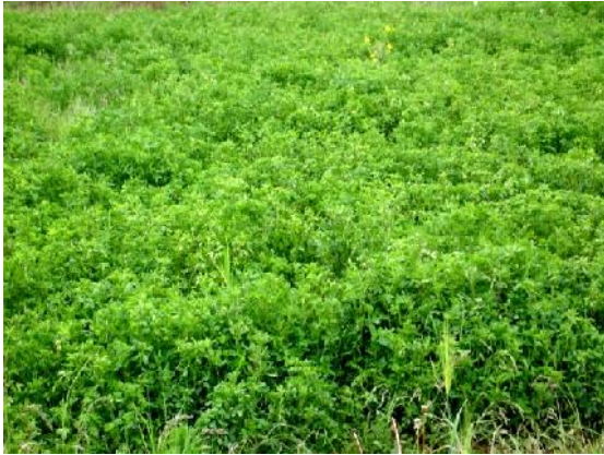
Fig. 2: Alfalfa ( Medicago sativa )