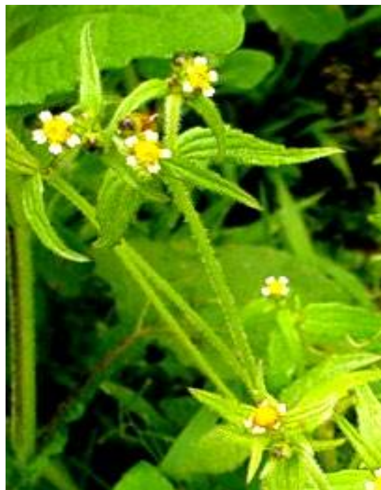
Fig. 45: Botón de oro