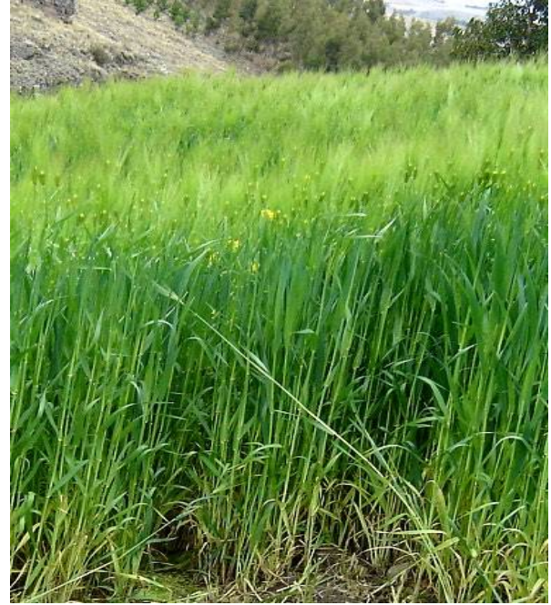
Fig. 34: Cebada en estado oportuno para la henificación