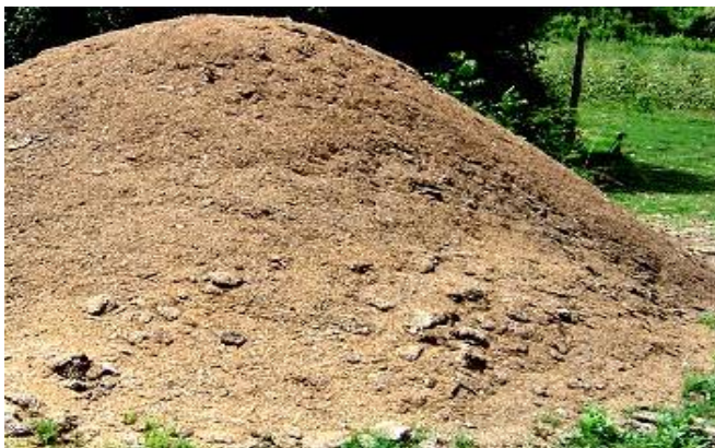
Fig. 17: Estiércol de gallinaza

La gallinaza es utilizada en los valles interandinos para el cultivo de papa, alfalfa y trébol principalmente, se puede emplear en casi todas las especies de plantas, es necesario hacer ajustes en el nitrógeno, de acuerdo con el contenido, con el material, para evitar excesos de este elemento. En cambio el contenido de potasio es relativamente bajo y con frecuencia se debe adicionar.