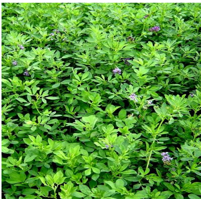
Fig. 20: Alfalfar en la comunidad de Tiraque

Leguminosa del género Medicago , flores pequeñas de color amarillo o violáceo. Comprende unas 50 especies. Medicago sativa la más cultivada, rica en proteínas y elevado contenido de vitaminas y calcio. La producción de alfalfa constituye uno de los recursos forrajeros de mayor relevancia, para la alimentación de los animales en la zona andina de Bolivia: valles y altiplano.