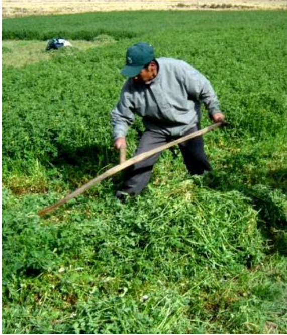
Fig. 33: Alfalfa segada para la henificación