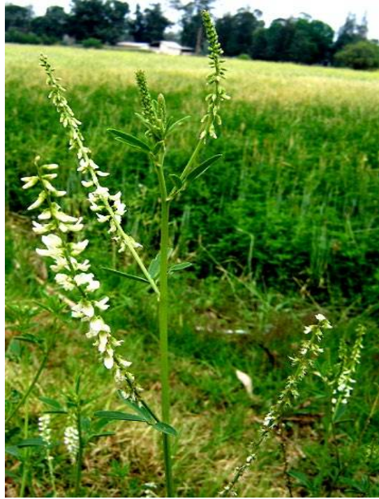
Fig. 38: Melilotus sp.