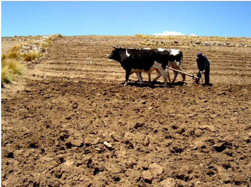
Fig. 13: Arado de la parcela antes de la siembra

El objetivo principal del arado es mejorar las condiciones físicas de los suelos y crear un ambiente adecuado para el desarrollo de las plantas que permita obtener buenos rendimientos de forrajes a bajo costo sin afectar las propiedades físicas y químicas de los suelos.