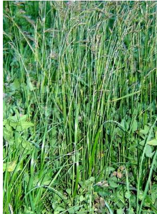
Fig. 9: Ryegrass Ingles ( Lolium perenne )