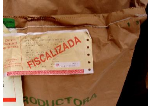
Fig. 46 y 47: Uso de semillas certificadas de procedencia conocida garantiza un buen establecimiento y rendimiento.