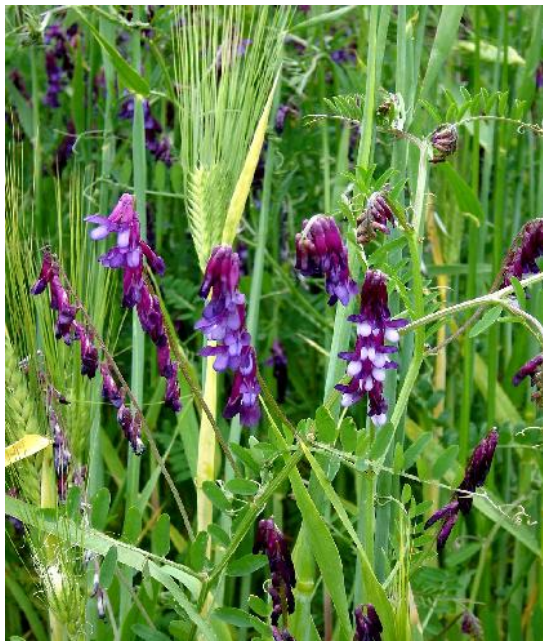
Fig. 4: Vicia Villosa (ssp. dasycarpa )