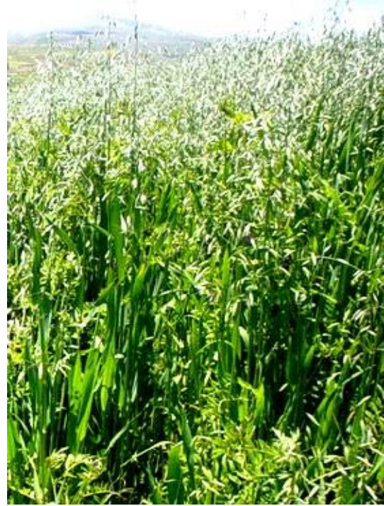
Fig. 7: Avena ( Avena sativa )