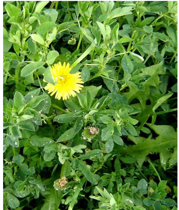
Fig. 41: Diente de león