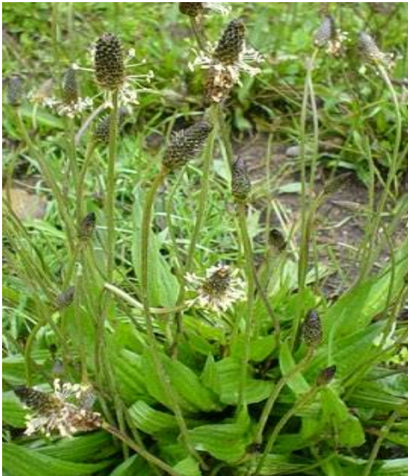
Fig. 40: Llantén