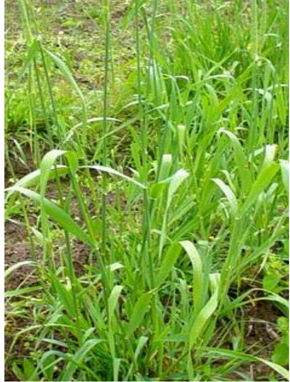
Fig. 11: Pasto brasileiro ( Paspalum phalaris )