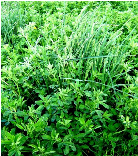
Fig. 21: Festuca alta asociada con alfalfa

Estas especies mencionadas se expresan con mejores actuaciones cuando se asocian a materiales de alfalfa de reposo invernal intermedio a largo. El Pasto ovido, ideal para mezclas con alfalfas por su baja exigencia en luminosidad, es una valiosa gramínea de ciclo perenne, pero demanda ambientes muy favorables.