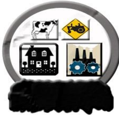
Figura1. Origen de las aguas residuales (domesticas, industriales, ganaderas y agrícolas).