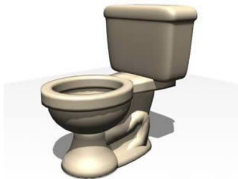
Figura 2. Principal fuente de las aguas negras.