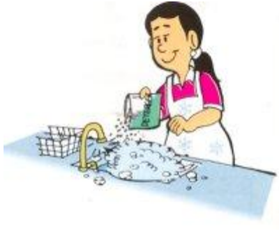
Figura 3. El lavado de los utensilios de cocina produce aguas grises