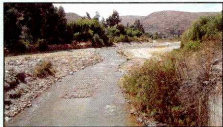
Figura 1. Río Pucara

Las tres represas se encuentran en otras provincias. Así Tatora Khocha y Lluskha Khocha y Muyu Loma se encuentran en la provincia Tiraque y Laguna Robada se encuentra en la Provincia Chapare. Los demás sistemas de aprovechamiento de agua se originan y se encuentran dentro el abanico de Punata.