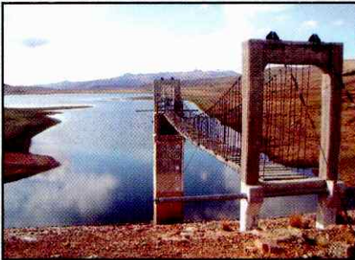
Figura 2. Represa Totora Khocha

En el caso de los sistemas de riego con pozos perforados, los canales de conducción son en parte los existentes, otra parte son canales paralelos de menor capacidad (de tierra o revestidos) y actualmente están implementando redes de tuberías, incrementando así el área bajo riego.