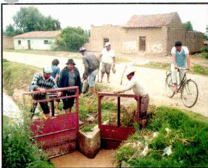
Figura 4. Reparto de agua comunal

A pesar de que los sistemas de riego se traslapan o se sobreponen, no existen interferencias considerables entre los distintos sistemas de riego, ya que evitan mezclar el agua de un sistema con otro, mostrando una alta coordinación entre ellos. Esto es explicable en parte, porque son los mismos usuarios de riego que cohabitan dentro de una misma área y utilizan prácticamente la misma infraestructura de conducción dentro del abanico.