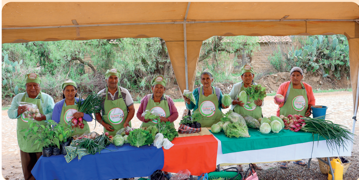
Foto 13. Productores/as en la Feria de ECOHUERTOS, en la comunidad de Catachilla