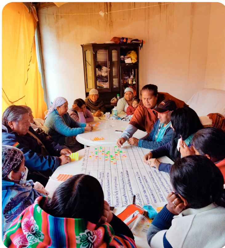
Foto 5. Espacio de diálogo entre productores/as y el equipo de investigación sobre resiliencia socio-ecológica