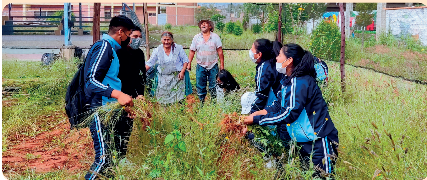
Foto 8. Trabajo comunal intergeneracional

Fuente: Proyecto de Servicios Agroecosistémicos y Resiliencia Socioecológica en Huertos Familiares Agroforestales, CESU-UMSS, 2023