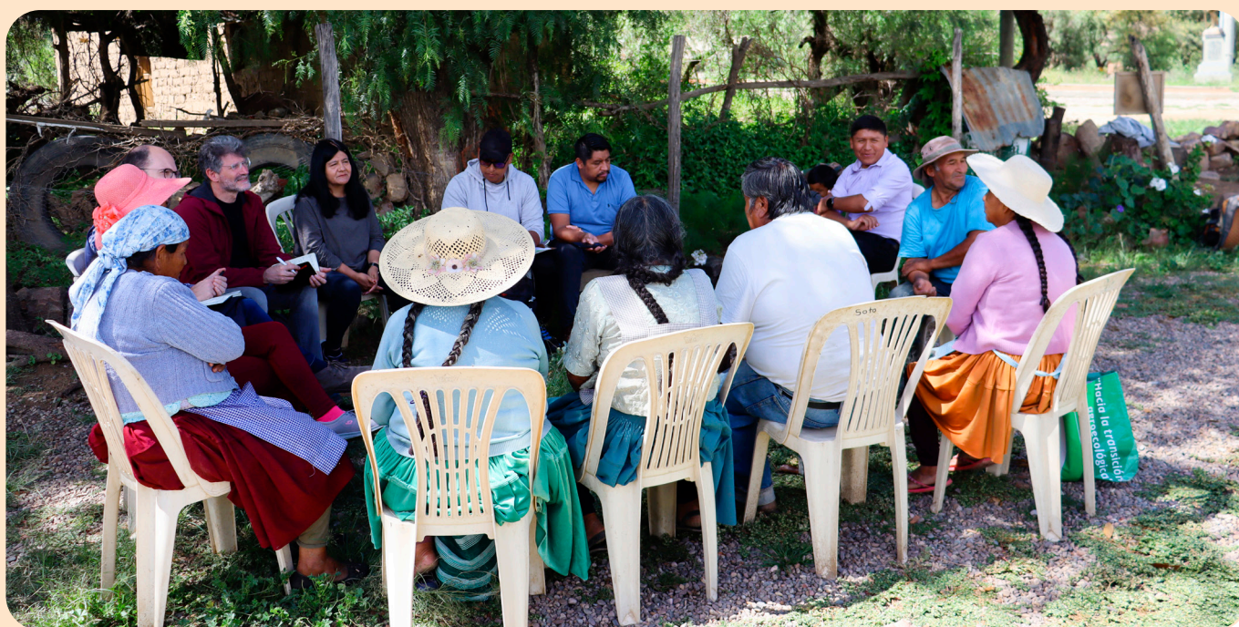
Foto 2. Espacio de diálogo entre familias productoras, equipo de investigación, G.A.M.S. e instituciones aliadas