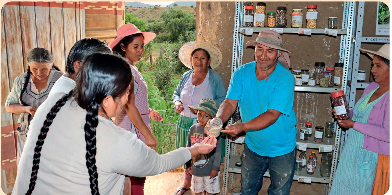
Foto 12. Productores y productoras criando y compartiendo las semillas