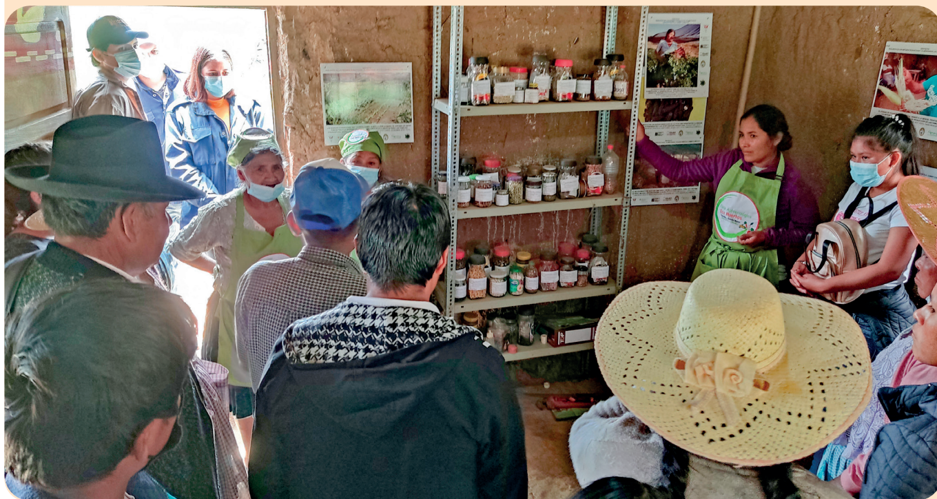
Foto 3. Intercambio de experiencias sobre la crianza de las semillas Visita al Muju Wasi - comunidad de Catachilla