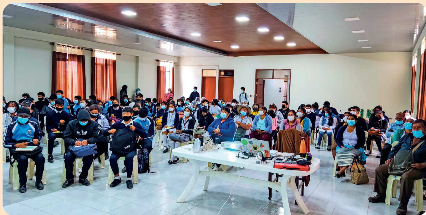
Foto 4. Espacio de diálogo y encuentro entre productores/as, estudiantes, técnicos/as municipales y equipo de investigación sobre sistemas agroforestales