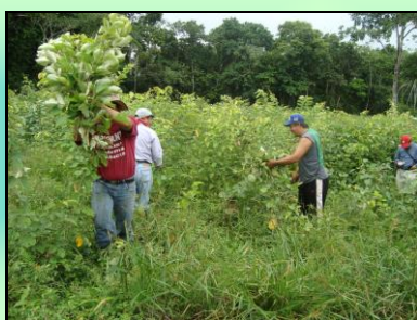
CORTE Y ACARREO