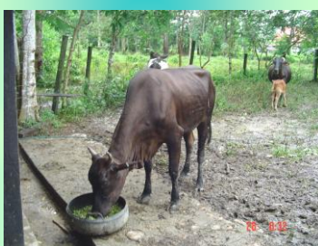
Consumo de C. argentea en fase de acostumbramiento