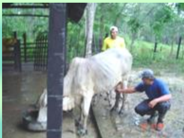
Módulo Lechero CATREN del Valle del Sacta - UMSS