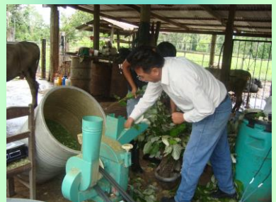
Utilización (forraje presecado y picado, ofrecido al momento del ordeño)