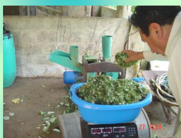
Pesaje de la oferta de forraje de C. argentea picado