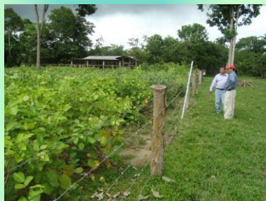
Producción forrajera (como banco de proteína ubicado muy cerca al establo)