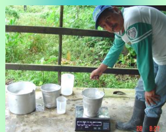
Determinación del efecto de C. argentea en producción de leche