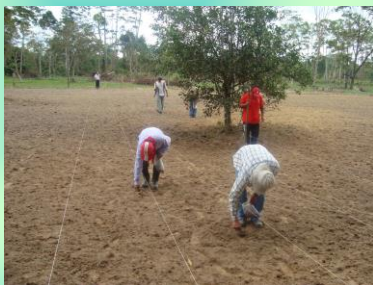
Siembra y establecimiento (en terrenos preparado o con labranza mínima)